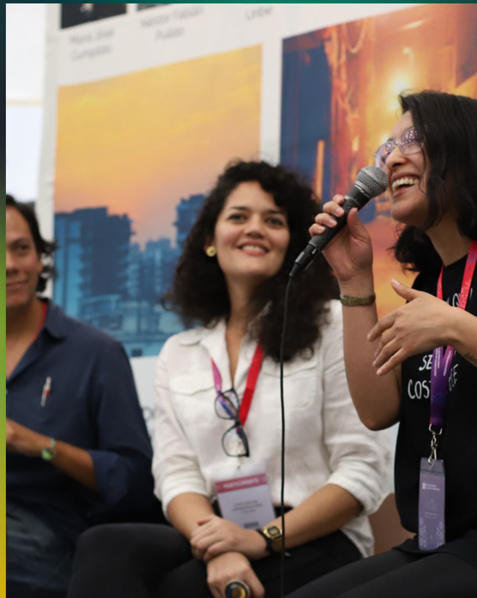
ENTRE AUTORES. 2019 Feria Internacional del Libro y Fondo de Cultura Económica. Evento Organizado por POIESIS/DIÁSPORA

Nuestra visión es crear una comunidad vibrante, diversa y participativa. Amantes del arte, donde la colaboración entre autores, lectores y oyentes florezca, y donde se celebre la riqueza de la creatividad como motor de cambio. Ofrecemos la red Diáspora para sumar al valor que cada artista imprime en su obra. Compartimos historias únicas y exclusivas que enriquezcan la experiencia cultural de nuestra audiencia y fortalezcan el tejido de América Latina.